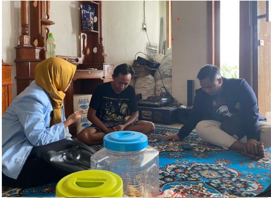
Gambar 3. Pendampingan pembuatan pembukuan akuntansi