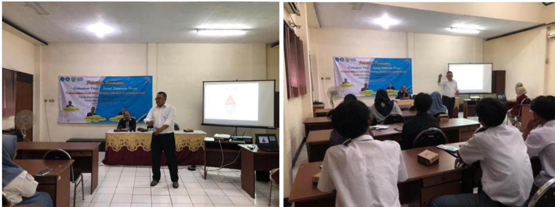
Gambar 6. Penyampaian materi oleh narasumber

Peserta yang hadir sangat bersemangat dan antusias dengan penyampaian materi oleh narasumber yang berjalan dengan sangat interaktif. Para peserta juga banyak melontarkan pertanyaan seputar CV maupun dunia kerja. Mereka mendapat tidak hanya pelatihan pembuatan CV tetapi juga insight mengenai dunia pekerjaan. Selesai pematerian dan praktek penyusunan CV berbasis ATS, acara langsung dilanjutkan menuju kegiatan Q&A, kuis, dan sampai di penghujung acara dan ditutup langsung dengan kegiatan foto bersama. Foto bersama dapat dilihat pada gambar 7;