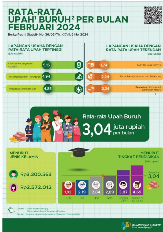
Gambar 2. Rata-Rata Upah Buruh Per Bulan Februari 2024

total masyarakat Indonesia per Februari 2024 berjumlah 1,84 juta jiwa dengan 25% persentasi yang mendominasi diurutan pertama, disusul dengan lulusan diploma dengan 3,87 juta dengan 21% persentase yang mendominasi diurutan kedua [4].