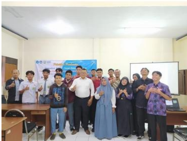
Gambar 7. Peserta Kegiatan dan Pemateri

Peserta yang hadir sangat bersemangat dan antusias dengan penyampaian materi oleh narasumber yang berjalan dengan sangat interaktif. Para peserta juga banyak melontarkan pertanyaan seputar CV maupun dunia kerja. Mereka mendapat tidak hanya pelatihan pembuatan CV tetapi juga insight mengenai dunia pekerjaan. Selesai pematerian dan praktek penyusunan CV berbasis ATS, acara langsung dilanjutkan menuju kegiatan Q&A, kuis, dan sampai di penghujung acara dan ditutup langsung dengan kegiatan foto bersama. Foto bersama dapat dilihat pada gambar 7;